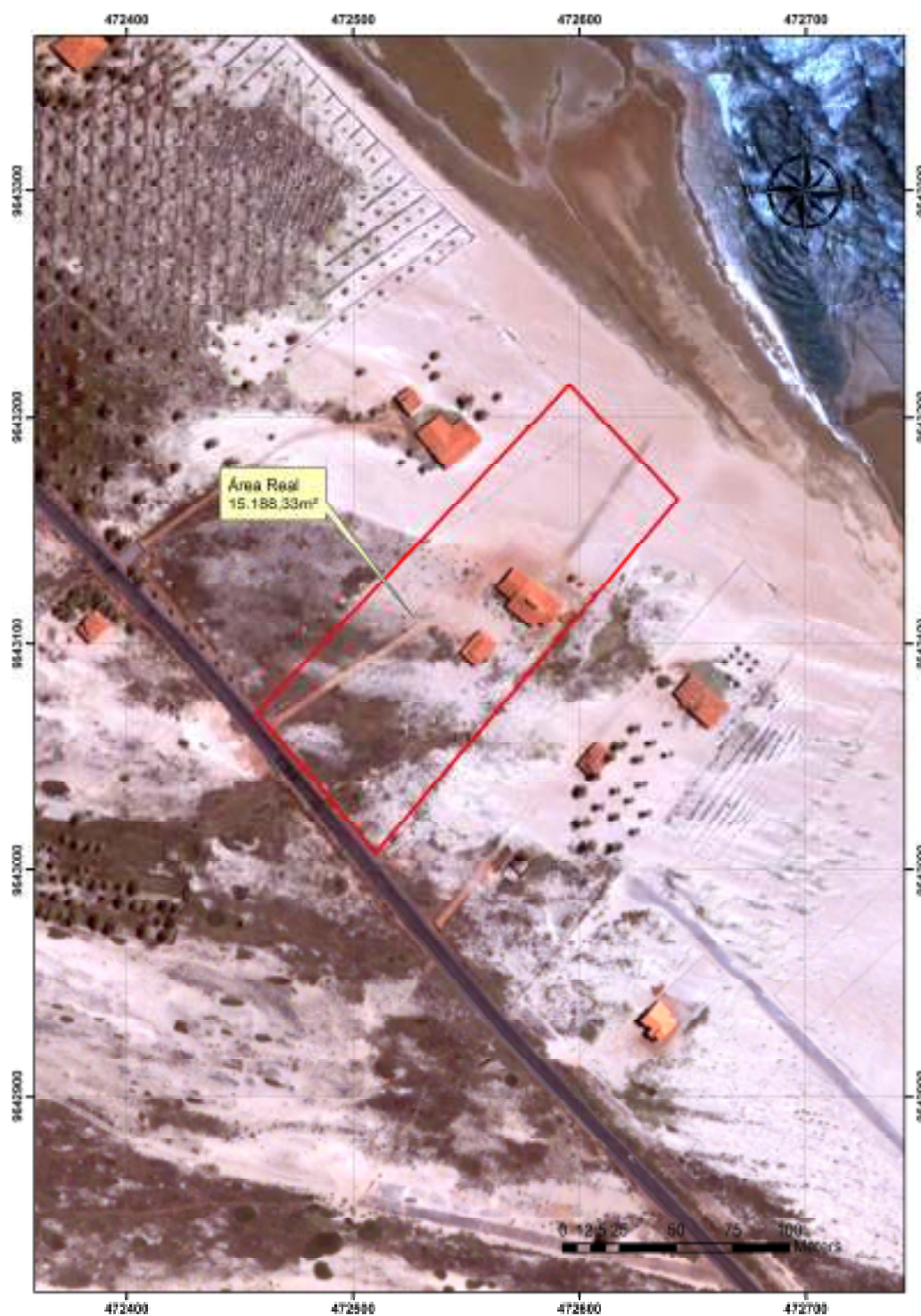
Figura 1.3 – Localização da Área do Empreendimento e seu Entorno