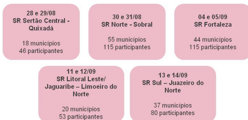
Figura 02 - Oficinas Regionais para a realização do Microplanejamento – Ceará, 2023

No Ceará, foram capacitados 20 profissionais na Oficina de Formação de Multiplicadores Estaduais para implantação das Atividades de Vacinação de Alta Qualidade - AVAQ e MP ofertada pelo MS nos dias 22 a 24 de agosto de 2023. Posteriormente, os multiplicadores estaduais realizaram Oficinas presenciais em cada Superintendência Regional - SR para iniciar o processo de MP nos territórios. Ao todo foram 174 municípios e 409 participantes (Figura 02).